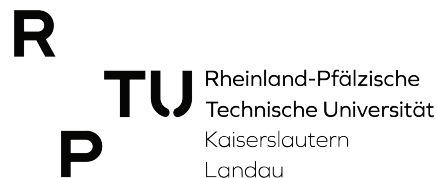
Abb. 2.1: RPTU Logo als .png

Grafiken können mittels \includegraphics eingefügt werden.